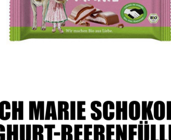
MILCH MARIE SCHOKOLADE JOGHURT-BEERENFÜLLUNG