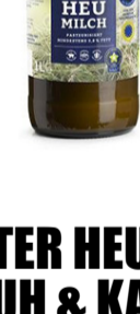
DEMETER HEUMILCH KUH & KALB