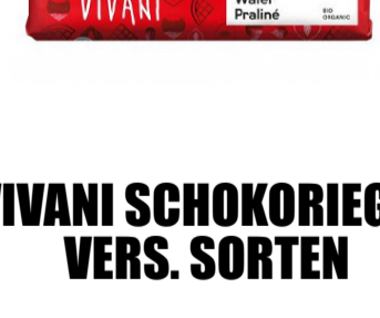
VIVANI SCHOKORIEGEL VERS. SORTEN